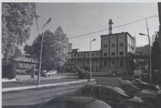
A volt kanizsai sörgyár napjainkban

1959. január 1-jén megalakult a Magyar Országos Söripari vállalat, ettől kezdve a korábbi önálló sörgyár a vállalat gyáraként működött tovább.