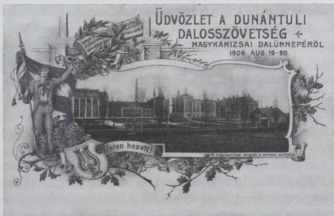
Üdvözlőlap a sörgyárban rendezett dalünnepről

A gyár épülete színhelye volt több kulturális eseménynek is. Ezek közül kiemelkedik az 1906. augusztusában megrendezett Dunántúli Dalosverseny, amelyen 13 énekkar vett részt. Az ország minden ötödik kórusa megjelent Nagykanizsán. Augusztus 18-ára kilobogózták a várost, a városháza előtt Vécsey Zsigmond polgármester köszöntötte a dalosokat. A verseny a sörgyár katakombáiban zajlott, ahová 2000 ember zsúfolódott be.