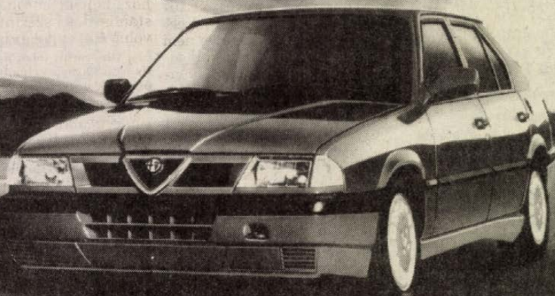
Jubilo Alfa Romeo

A híres és nagymúltú Alfa Romeo gyár magyarországi vezérképviselete, a Mercator, egy éve kezdte meg a sportos és csúcsteljesítményű Alfa Romeo személygépkocsik forgalmazását. Ezt az alkalmat Önnek szeretnénk megünnepelni. Ha 1992. augusztus 29-én 9 és 19 óra között a jobb alsó sarokban található kuponnal betér szalonunkba és részt vesz születésnapunkon, értékes ajándékkal lepjük meg. Ha szeret és tud vezetni, -akkor kipróbálhatja a "Jubilo Alfa