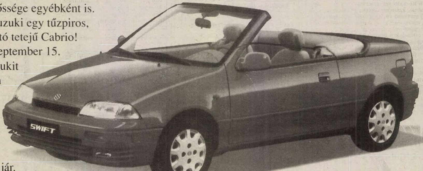
Suzuki SWIFT Cabrio 1.3 GS