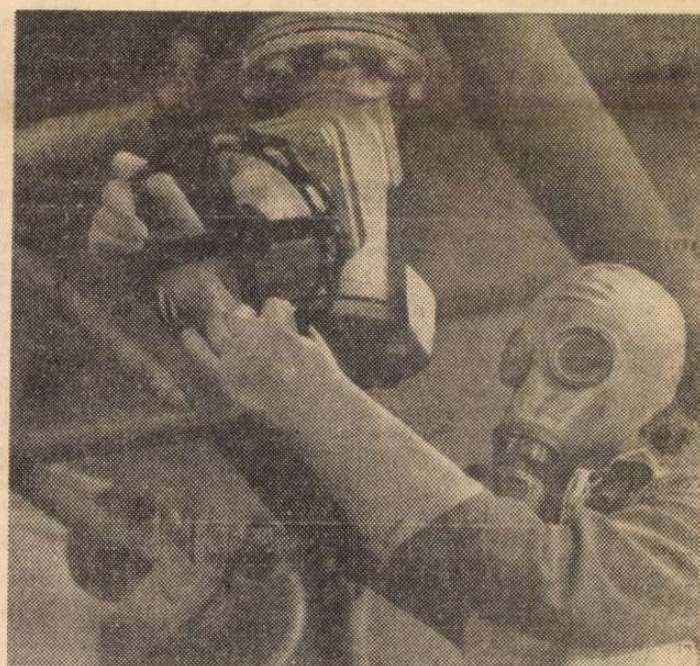
A Budapesti Vegyiművekben megkezdte próbaüzemelését az OLITREF nevű gyomirtószert gyártó üzemrész. A paprika, paradicsom, napraforgó, szőjabab gyomtalánítására használható vegyszer hazai gyártása évente több millió dollár megtakarítást jelent. Képünkön: a modern üzem részlete.